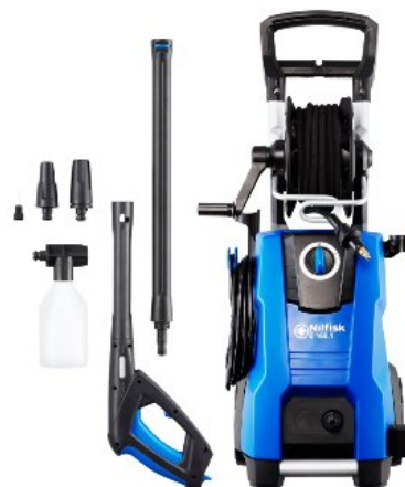
Zdjęcia produktów mają charakter poglądowy

W celu poprawienia wydajności, ten model myjki Nilfisk jest wyposażony w złącze Click&Clean do opcjonalnych akcesoriów.