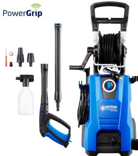
Zdjęcia produktów mają charakter poglądowy