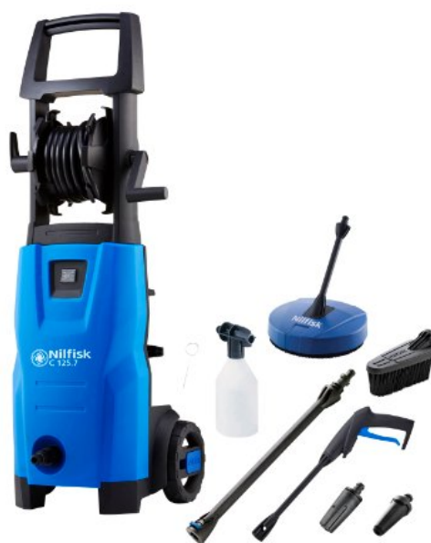
Zdjęcia produktów mają charakter poglądowy