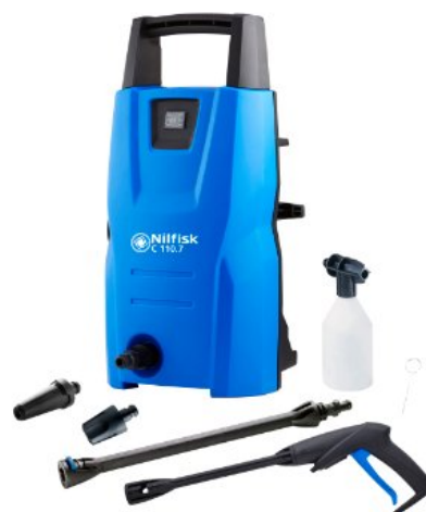
Zdjęcia produktów mają charakter poglądowy