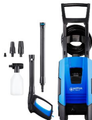
Zdjęcia produktów mają charakter poglądowy