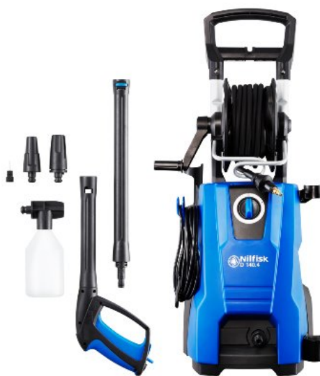
Zdjęcia produktów mają charakter poglądowy