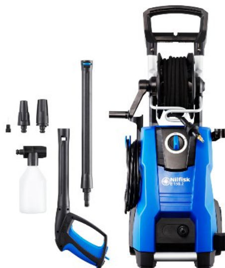
Zdjęcia produktów mają charakter poglądowy