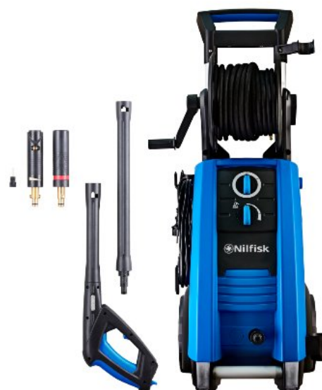
Zdjęcia produktów mają charakter poglądowy