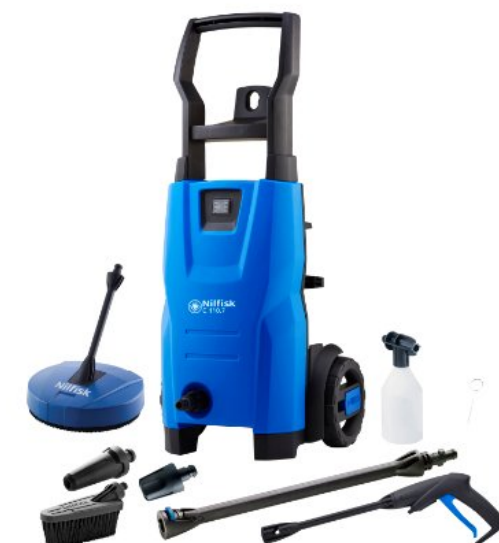
Zdjęcia produktów mają charakter poglądowy