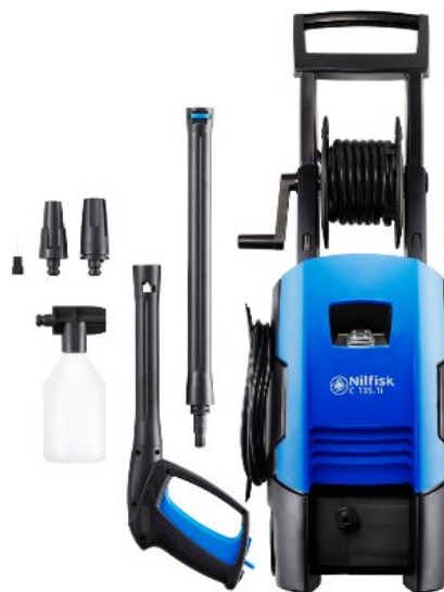
Zdjęcia produktów mają charakter poglądowy