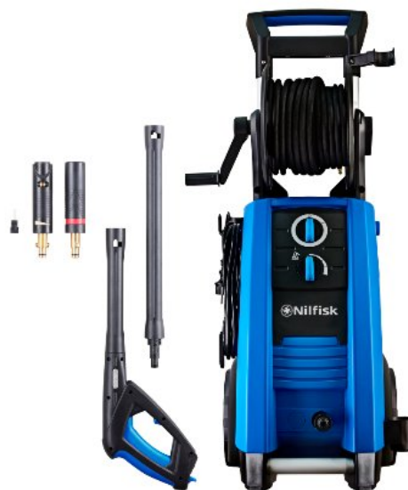
Zdjęcia produktów mają charakter poglądowy