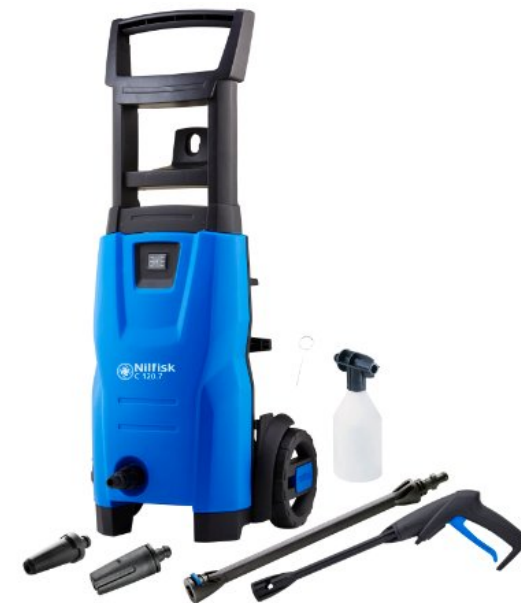
Zdjęcia produktów mają charakter poglądowy